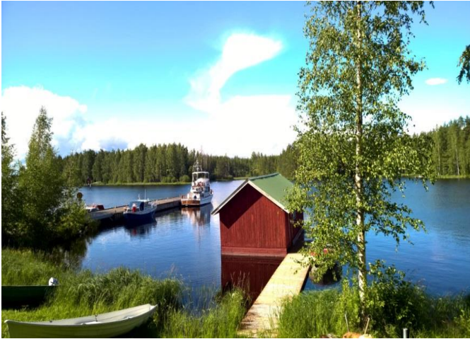
Primavera ilmestyy yllättäen satamaan, riittää juttukavereitakin

Aurinko ja sade vaihtelevat keskenään, sade voittaa. Olimme menossa Linnanvuorelle, mutta ei tässä säässä. Hyypiänniemeltä löydämme kunnollisen laiturin, rannassa vanhan meijerin rakennukset, kahvila on suljettu. Myöhään illalla tulee vielä purjevene laiturille. Tilaamme Savonlinnasta oopperalippuja, ohjelmassa on moderni versio La Traviatasta. Aamupäivällä on pilvistä, mutta tullessamme kasinorantaan paistaa aurinko ja on lämmintä. Torilla maistuu muikut ja illan esitys miellyttää meitä. Seuraavana päivänä sataa melkein taukoamatta. Nopeat ostokset ja muuten on lepopäivä. Kun